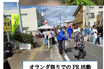
オランダ祭りでのPR活動