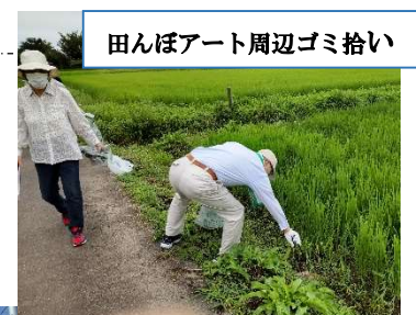
田んぼアート周辺ゴミ拾い

尚、ふくしま駅伝前の鳥見山陸上競技場周辺の落葉掃きは残念ながら雨天のため中止といたしました。