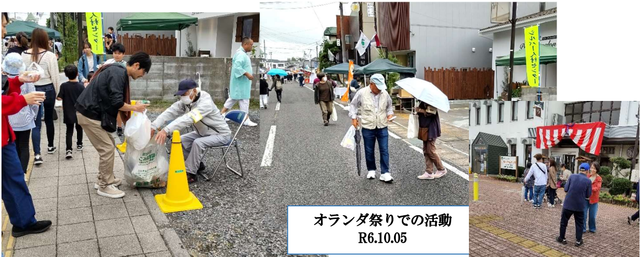
オランダ祭りでの活動 R6.10.05