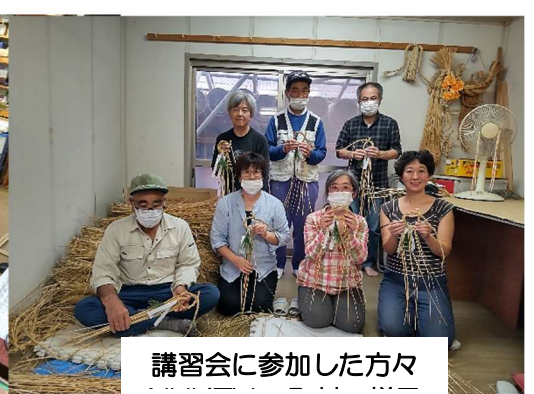
講習会に参加した方々