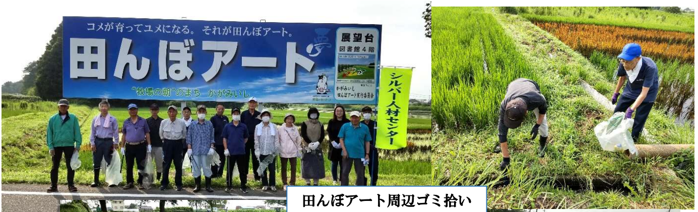
田んぼアート周辺ゴミ拾い R06.7.13

尚、11月15日にふくしま駅伝事前の鳥見山陸上競技場周辺の落葉掃きを行う予定にしておりましたが、残念ながら雨天のため作業中止となりました。